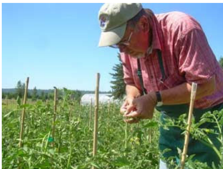
création variétale: prune noire X green zebra